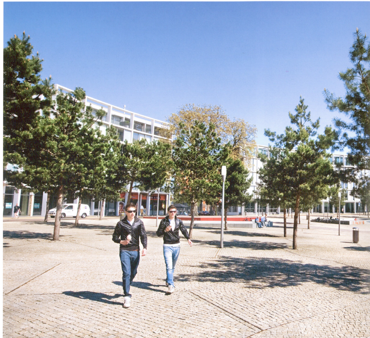
Het stationsplein is uitgevoerd met Portugees graniet, en aangekleed met Veluwe dennen.

LOCATIE: Apeldoorn PROJECT: ontwerp van nieuw stadsplein ONTWERPER: Lodewijk Baljon landschapsarchitecten (Lodewijk Baljon, Mark van der Bij, Karin van Essen, Pieter van Walree, Rob Aben) IN SAMENWERKING MET: Giny Vos (ledkunstwerk) OPDRACHTGEVER: Combinatie Infra Forumpark Apeldoorn (gemeente Apeldoorn, BAM, Heijmans) OPPERVLAKTE: 1 ha ONTWERP: 1999 – 2005 REALISATIE: 2005 – 2008