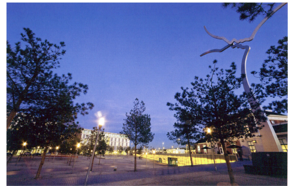
De skatebaan op het plein is een veelgebruikte attractie.