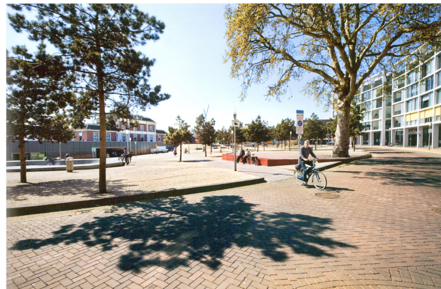
Het balkon bij het oude station. De fietsverbinding naar het centrum. De bomen zijn geplant in boombunkers om optimale groeiomstandigheden te creëren. De rode lakdoos om de plataan dient als zitelement.